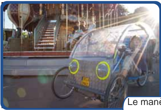
Le manège des grands