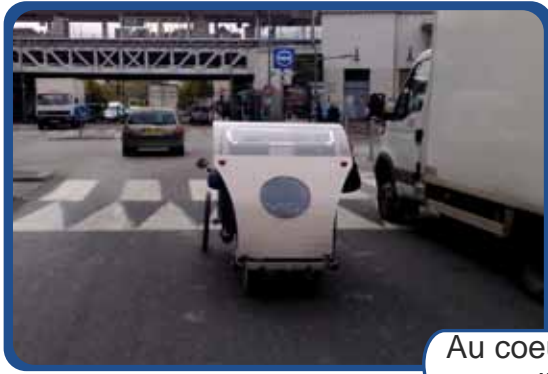
Au coeur de la ville