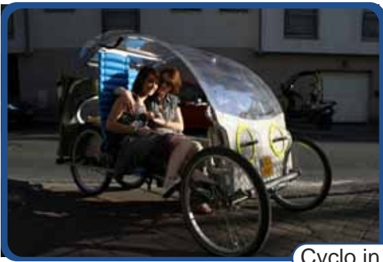
Cyclo in the city