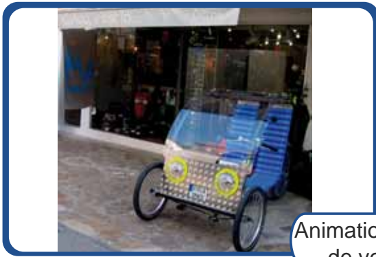
Animation points de ventes