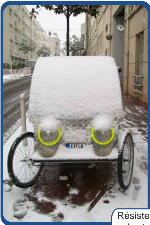
Résiste à tous les temps