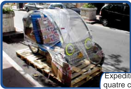
Expedition aux quatre coins du monde