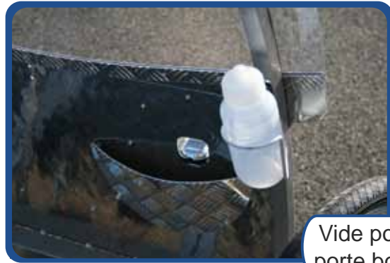
Vide poche et porte bouteilles