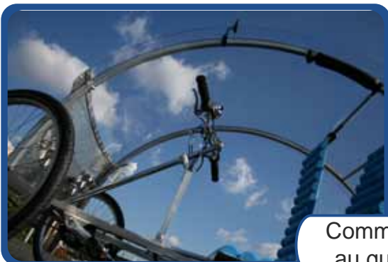
Commande au guidon