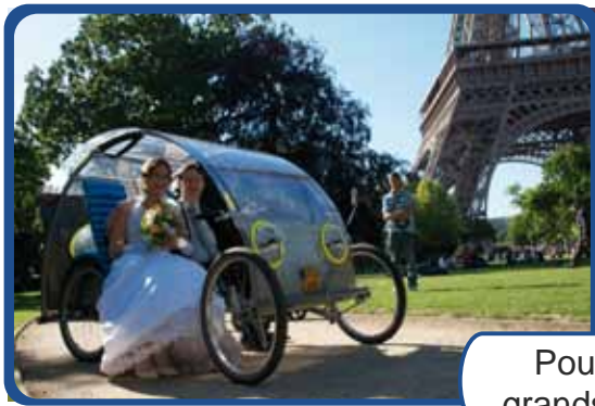
Pour les grands jours